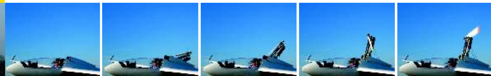
In soli 10 secondi si estrae il motore pronto per l'avvio